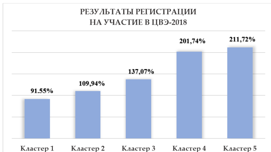
Рисунок 2. Данные регистрации на участие в ЦВЭ 2018 года

201,74% от общего количества мест согласно плану приёма студентов в рамках данного кластера, на третьем – 3-ий кластер – 137,07% от общего количества мест согласно плану приёма студентов в рамках данного кластера, на четвёртом – 2-ой кластер – 109,94% от общего количества мест согласно плану приёма студентов в рамках данного кластера и на пятом – 1-ый кластер – 91,55% от общего количества мест согласно плану приёма студентов в рамках данного кластера.